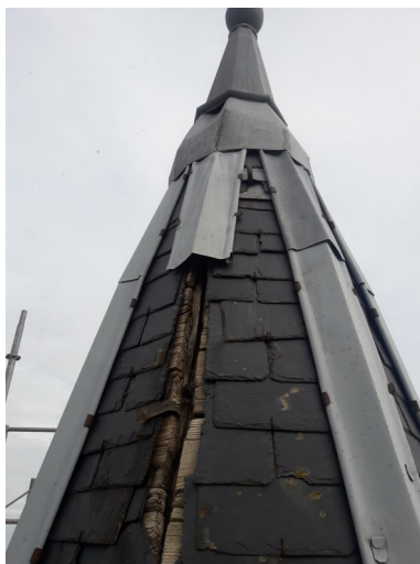
Progression du chantier : avant, pendant et après travaux.

Dans les mois à venir plusieurs chantiers vont voir le jour, le crépis de l'église de Saint-Julien, la réparation des cloches et de l'électricité de l'église de Lincou et la réparation et mise au norme des cloches de Lebus.